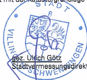
gez. Ulrich Götz Stadtvermessungsdirektor