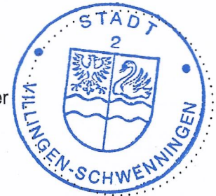
gez. Detlev Bühler, Erster Bürgermeister