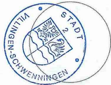
gez. Detlev Bühner, Erster Bürgermeister