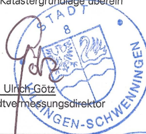
gez. Ulrich Götz Stadtvermessungsdirektor