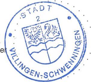
gez. Detlev Bührer, Erster Bürgermeister