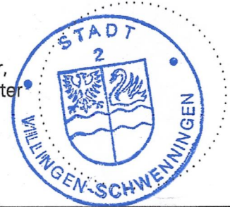
gez. Detlev Bühler, Erster Bürgermeister